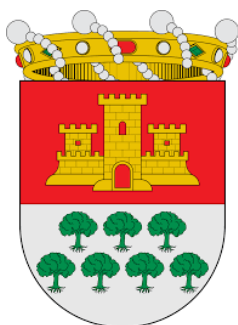
Excelentísimo Ayuntamiento de Cheste