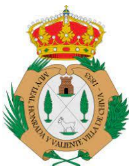
Excelentísimo Ayuntamiento de Chiva