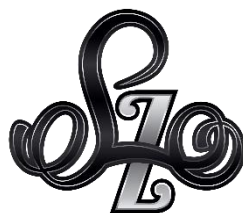
Fundación Loida Zabala